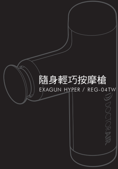
隨身輕巧按摩槍 EXAGUN HYPER / REG-04TW